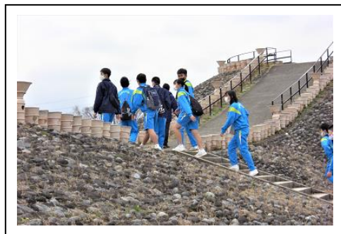
本物の古墳の上からの眺めは

町野球クラブの方に法面の敷を整備していただきました。来年シーズンは、こざっぱりとした中で練習に励むことができそうです。ありがとうございます。