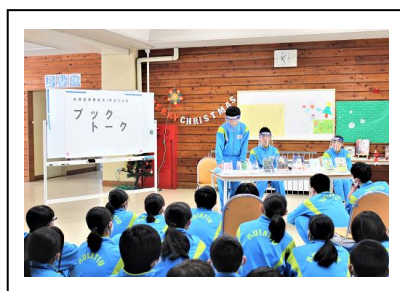
図書委員によるブックトーク 12/17

絵付けの際に誰もが感じる「ふたつの難しさ」を社長さんから教わりました。ひとつは筆を使う技術的な難しさ、もうひとつは願いを込めるものをつくるため「うまく描こう」と気負うことからの難しさです。思いを込めて描ければそれでよいというお話に、生徒は肩の力を抜いて自由に筆を運んでいました。