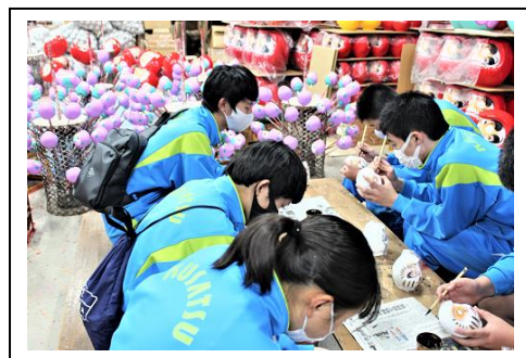
だるまに囲まれての絵付け体験

表面の石は河原の丸石。いったい何個使って…。エジプトのピラミッドは仕事を生み出し、人々に給与を払うための事業だったという説もありますが…。